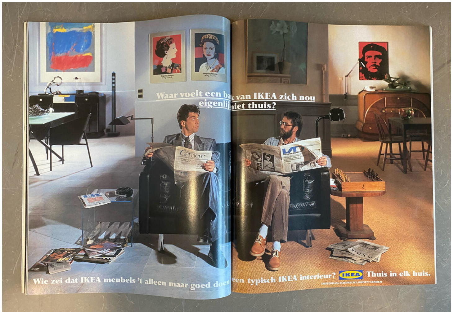
IKEA-advertentie met een leuke verwijzing naar Vrij Nederland uit 1988.

Uit het milieurapport valt af te leiden dat 'klimaatpositief in 2030' niet betekent dat de meubelboer dan min of meer uitstootvrij is: het streven is een '15 procent afname van broeikasgassen in absolute termen ten opzichte van 2016', wat nog steeds zou neerkomen op een jaarlijkse uitstoot à 20,4 miljoen ton (of megaton) CO 2 (amper minder dan de 21,1 miljoen ton uitstoot in 2020). Het klimaatvoordeel moet vervolgens worden gezocht in 'het opslaan van koolstof in land, planten en producten, en door het bewerkstelligen van verdere CO 2 -afnames in de maatschappij'.